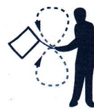
Drapeau agité en 8